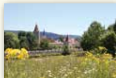
Stadt Berching www.berching.de