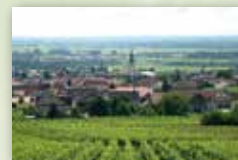
Stadt Maikammer www.maikammer.de