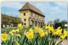
Stadt Blieskastel www.blieskastel.de