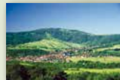
Stadt Bischofsheim a. d. Rhön www.bischofsheim.info