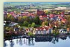
Stadt Penzlin www.penzlin.de