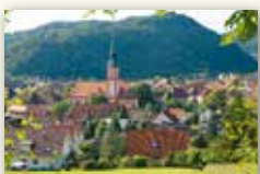
Stadt Waldkirch www.stadt-waldkirch.de