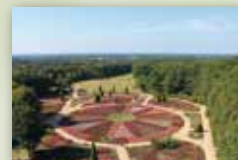
Stadt Schneverdingen www.schneverdingen.de