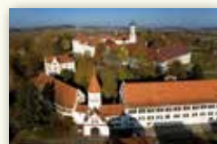
Stadt Bad Schussenried www.bad-schussenried.de