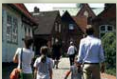
Stadt Meldorf www.meldorf-nordsee.de