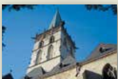
Stadt Lüdinghausen www.luedinghausen.de