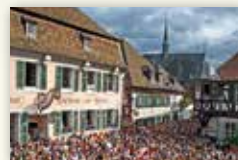
Stadt Deidesheim www.deidesheim.de