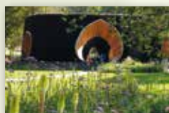
Stadt Bad Essen www.badessen.de