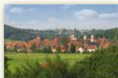
Stadt Spalt www.spalt.de