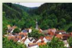
Markt Wirsberg www.wirsberg.de