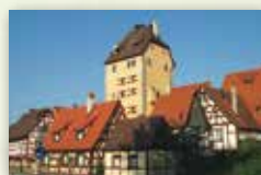
Stadt Hersbruck www.hersbruck.de