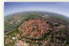
Stadt Nördlingen www.noerdlingen.de