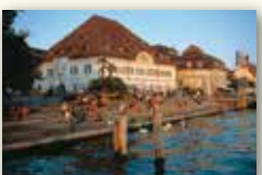
Stadt Überlingen www.ueberlingen.de